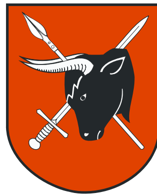
Współczesna wersja herbu miasta Sejny

W 1956 roku Sejny ponownie zostały siedzibą powiatu (do 1975 roku) .