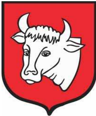
Wersja herbu miasta Sejny z 1963 roku

W 1963 roku miasto Sejny obchodziły 400 lecie otrzymania praw miejskich.