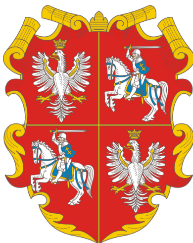
Herb Rzeczypospolitej Obojga Narodów

Po podpisaniu unii lubelskiej w 1569 r. Litwini i Polacy żyli w zjednoczonym państwie – Rzeczypospolitej Obojga Narodów – przez ponad dwa stulecia.