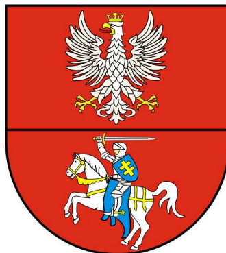
Herb województwa podlaskiego

24.07.1998 uchwalono ustawę o wprowadzeniu decentralizacyjnego trójstopniowego podziału terytorium państwa. Ustawa weszła w życie od 1.01.1999 r., wg ustawy jednostkami tego podziału są gminy, powiaty i województwa. Wśród 16 nowych województw powstało województwo podlaskie z siedzibą w Białymstoku. W skład województwa weszło 118 gmin i 14 powiatów, w tym powiat sejneński, który obejmuje miasto Sejny i gminy: Sejny, Giby, Krasnopol i Puńsk.