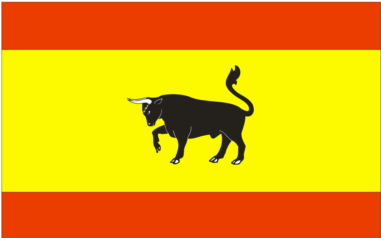
TABELA PRZEŁOŻENIA BARW HERBU I FLAGI W SYSTEMIE CMYK:

kolor czerwony C= 0% M=100% Y= 100% K=0%