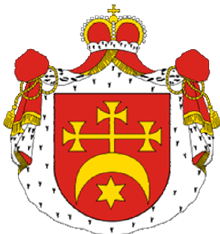
Korybut – Herb rodowy kniazia Iwana Michajłowicza Wiśniowieckiego

Dokument znajduje się w Muzeum Ziemi Sejneńskiej. W 1564 roku - król Zygmunt August potwierdza to nadanie synowi Iwana - Andrzejowi. Data ta jest przyjmowana jako data powstania Sejn, bowiem w królewskim dokumencie po raz pierwszy pojawia się nazwa Sejny.