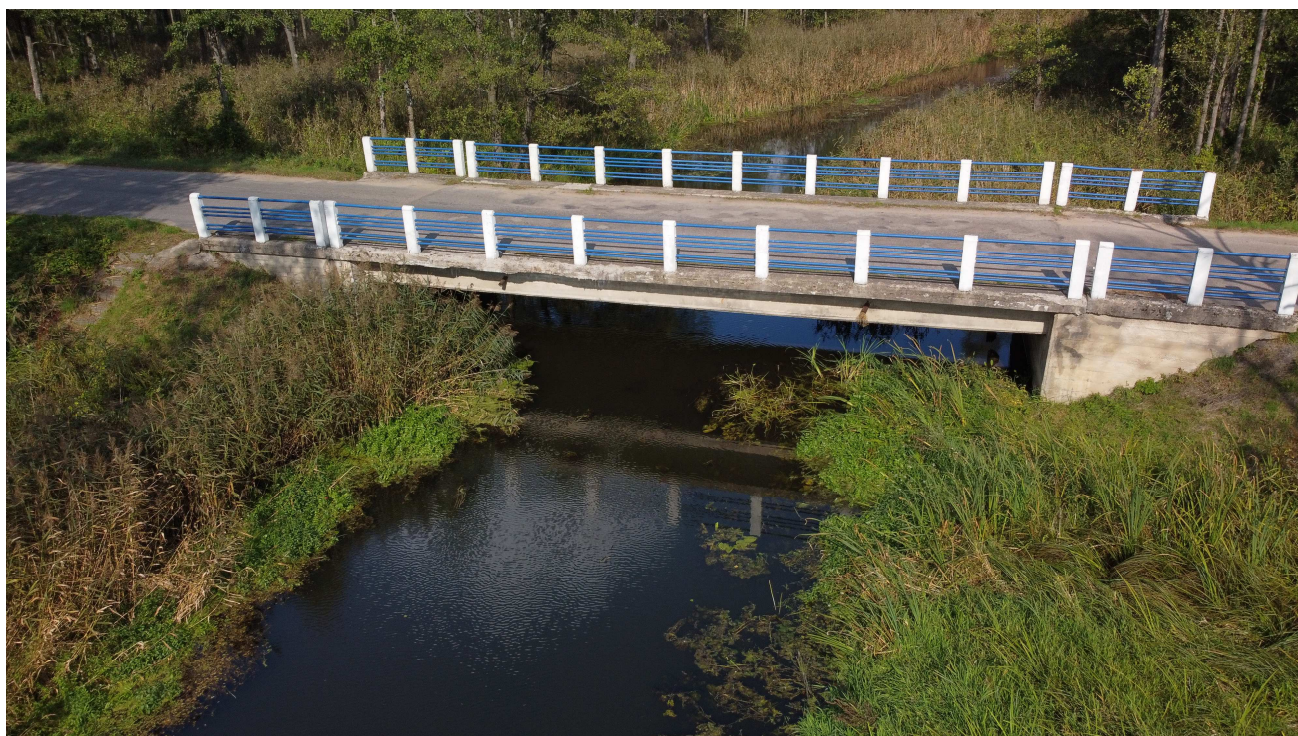
Fot. 1. Widok wzdłuż mostu od strony dołu rzeki.