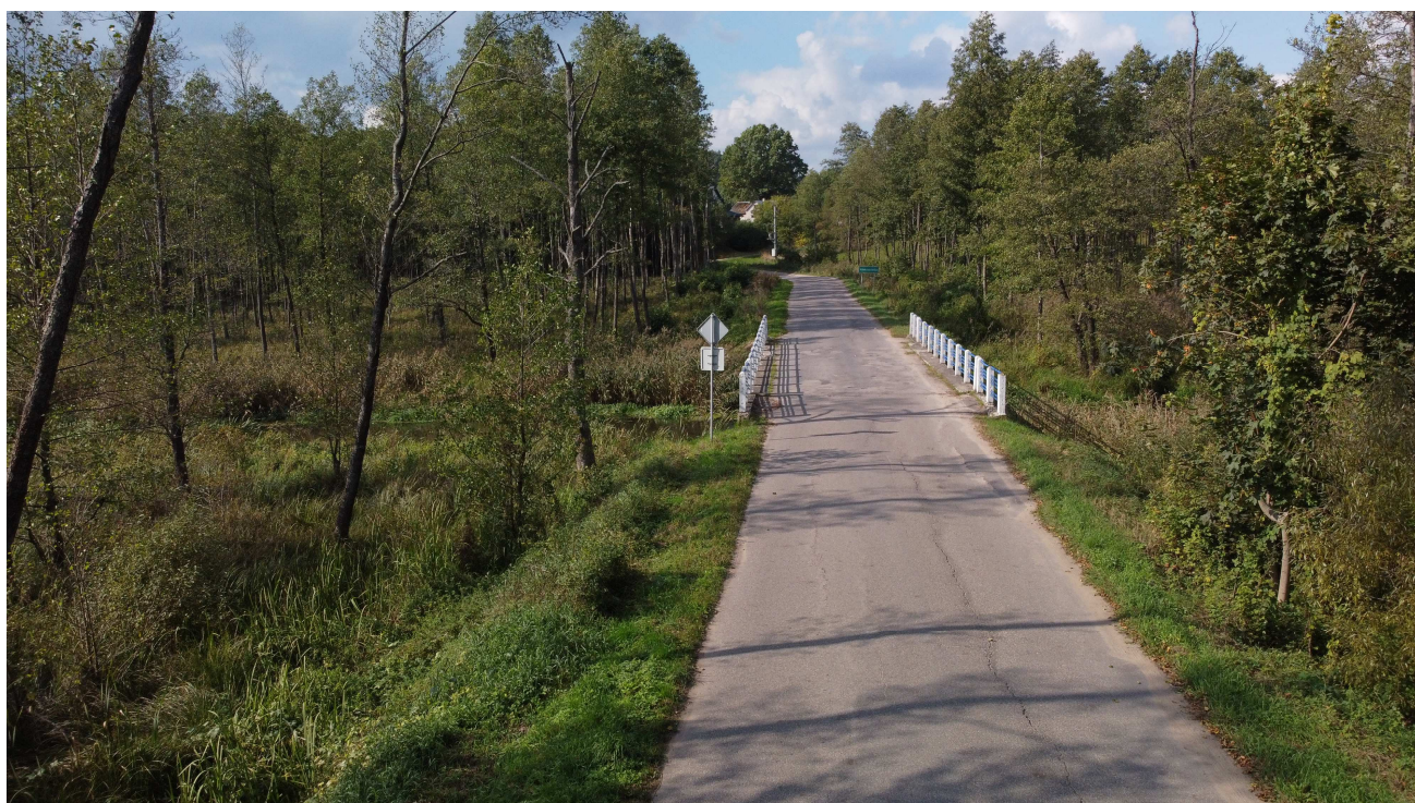
Fot. 2. Widok dojazdu od strony m. Berżniki