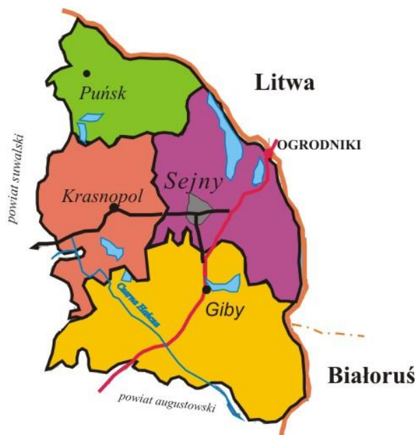
Tabela 1. Podział administracyjny Powiatu Sejneńskiego

Powiat sejneński zajmuje powierzchnię 855 km 2 (4,2 % obszaru województwa podlaskiego), w tym lasy stanowią 42% ogólnej powierzchni, 48% stanowią użytki rolne, 10% stanowią akweny wodne i pozostałe tereny.